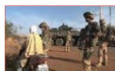
Mon pays est en guerre.