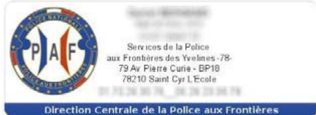
PAF : Police de l'Air et des Frontières appelée maintenant "police aux frontières"

S'en suit une convocation pour entretien. Si les documents sont considérés comme faux, le procureur peut décider d'une garde à vue.